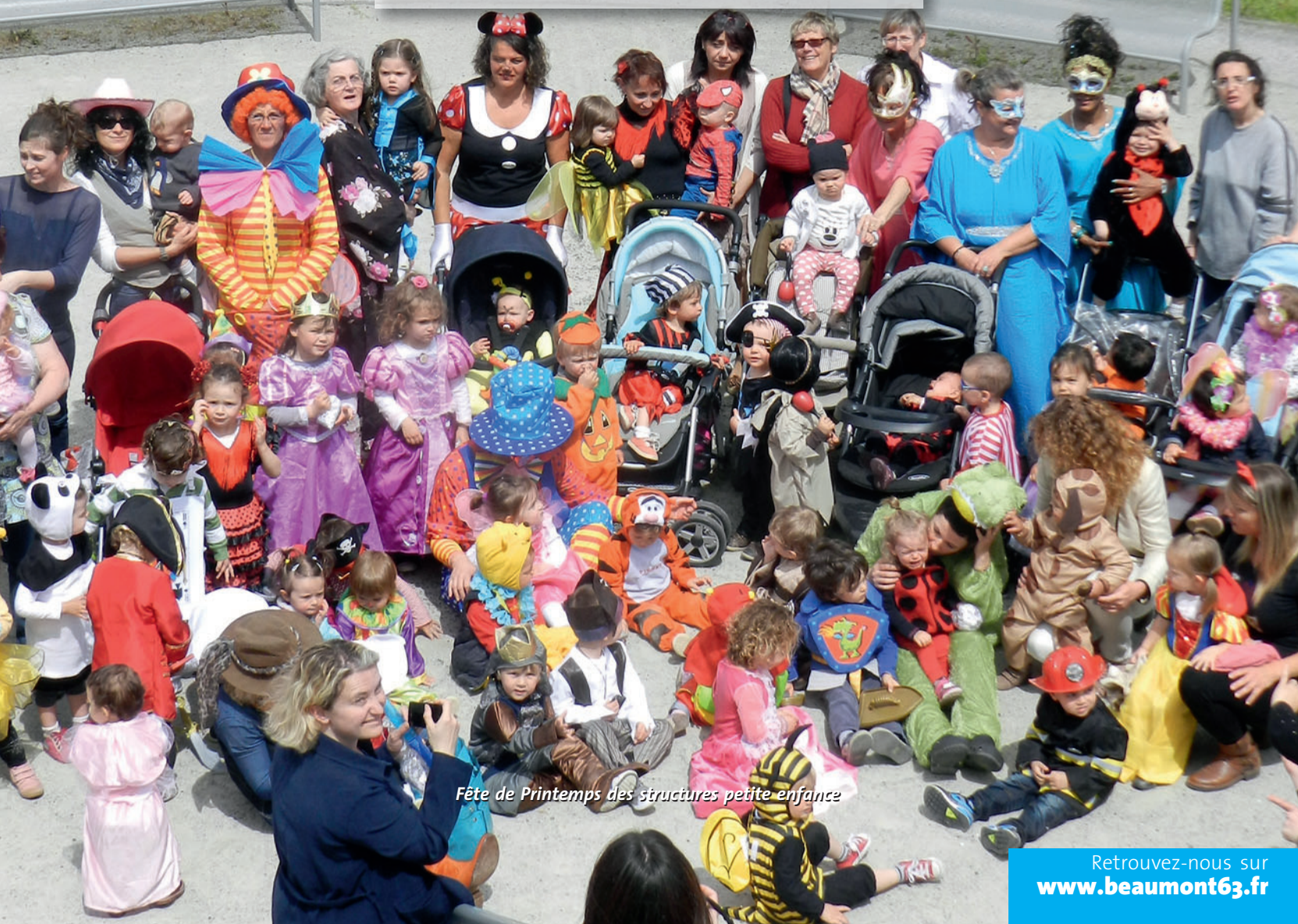
Fête de Printemps des structures petite enfance