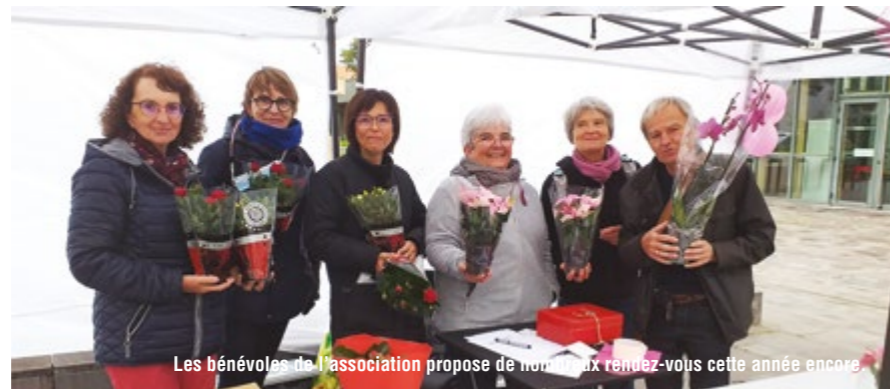
Les bénévoles de l'association propose de nombreux rendez-vous cette année encore.

Contact A Tout Cœur - C.A.B, rue René brut / Tél : 06 81 99 31 82 – e-mail : atoutcoeur.beaumont@gmail.com / http://atoutcoeur-beaumont.fr