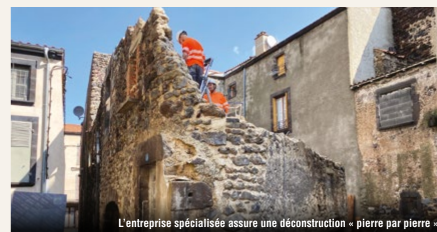
L'entreprise spécialisée assure une déconstruction « pierre par pierre ».

Afin d'améliorer l'esthétique et renforcer l'attractivité du centre-bourg, la Ville de Beaumont a mandaté l'EPF Auvergne pour mener des travaux de déconstruction de bâtiments insalubres. Depuis le début de l'été, une entreprise spécialisée inter-