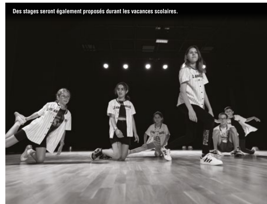
Des stages seront également proposés durant les vacances scolaires.

Contacts : asendansebeaumont@hotmail.com / Tél : 06 85 44 55 75 - 07 68 40 15 70 ou 06 60 61 12 05 - www.asendanse-63.com