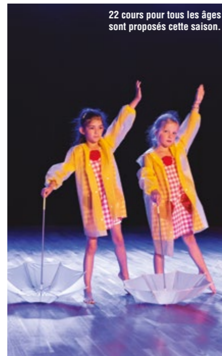
22 cours pour tous les âges sont proposés cette saison.

Il sera possible de rencontrer les membres de l'association pour des renseignements et les inscriptions :