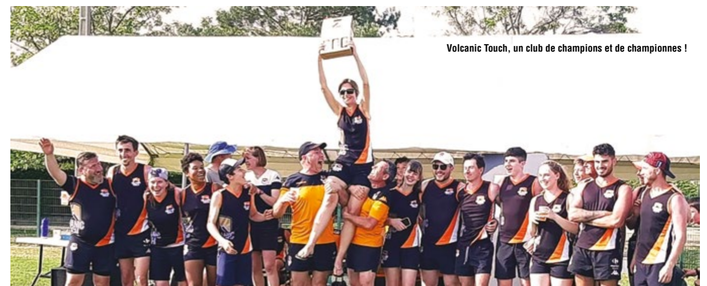
Volcanic Touch, un club de champions et de championnes !

Contact via la page Facebook (Volcanic Touch) ou à l'adresse mail suivante : volcanictouchrugby@gmail.com