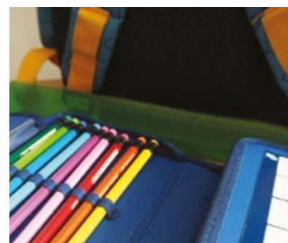
Parents et élèves ont rendez-vous le 9 septembre au Masage et le 16 septembre à Jean Zay.

musicale, buvette... égayent cette fête qui se veut avant tout festive et conviviale.