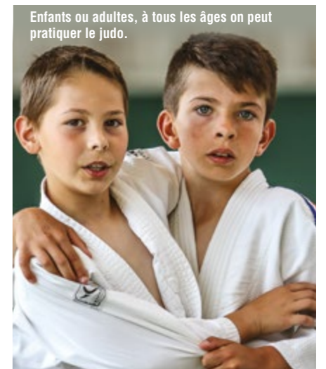
Enfants ou adultes, à tous les âges on peut pratiquer le judo.

Contact : 06 18 56 55 77 ou 06 62 90 36 84