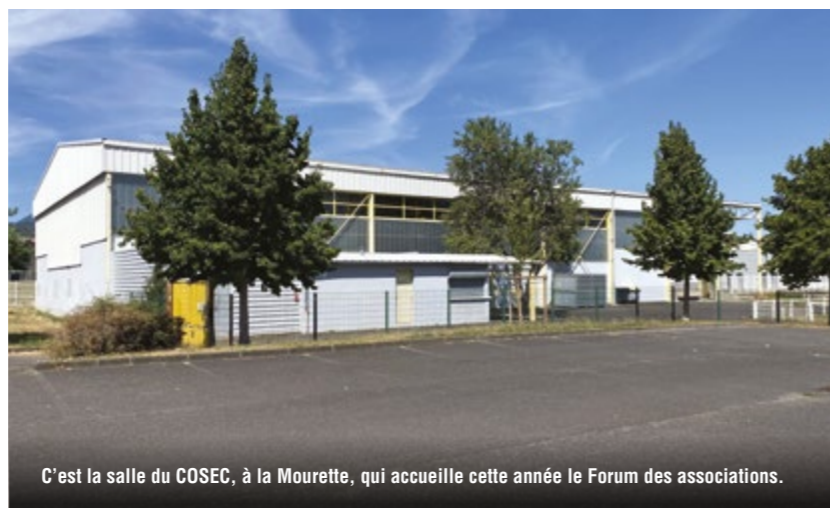
C'est la salle du COSEC, à la Mourette, qui accueille cette année le Forum des associations.

Au cours des derniers mois, après la parenthèse et les difficultés engendrées par le Covid, nous avons pu constater que les activités ont bien repris dans le monde associatif. En atteste les nombreuses assemblées générales qui ont eu lieu au printemps et au début de l'été. Plus généralement, depuis quelques années, l'offre associative dans la ville se diversifie et de nouvelles structures se créent. C'est encore le cas cette année avec la naissance d'associations œuvrant dans les secteurs de la danse, de la détente ou de la relaxation. Tout cela démontre, s'il en était besoin, le réel dynamisme du tissu associatif beaumontois.