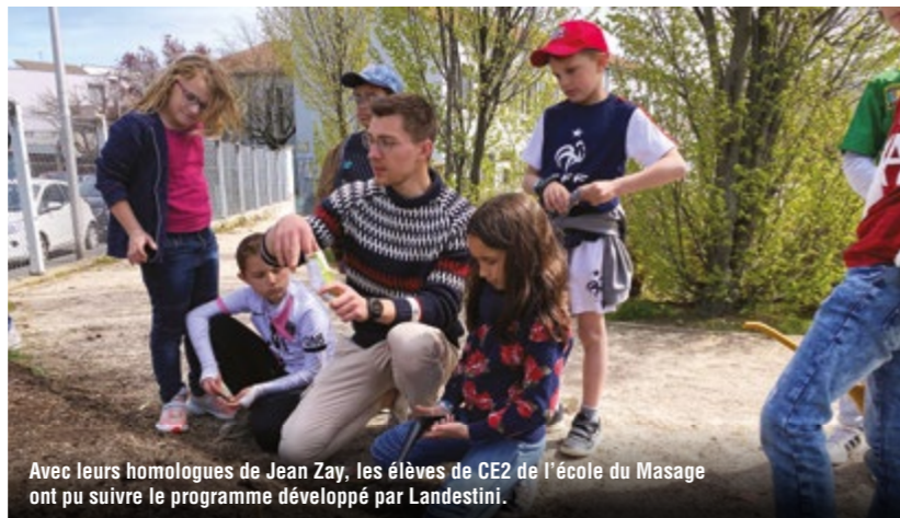
Avec leurs homologues de Jean Zay, les élèves de CE2 de l'école du Massage ont pu suivre le programme développé par Landestini.

Tout au long de l'année scolaire 2021-2022, les équipes de l'association Landestini sont intervenues dans les deux groupes scolaires de la ville. Ce volet pédagogique, développé dans le cadre de la zone maraîchère, a remporté un franc succès pour une première année d'existence. Deux classes ont suivi un programme innovant intitulé « Champions de l'alimentation durable et de la biodiversité ». Ateliers théoriques et pratiques, visites sur le terrain, échanges avec une autre école ont ponctué l'année scolaire.