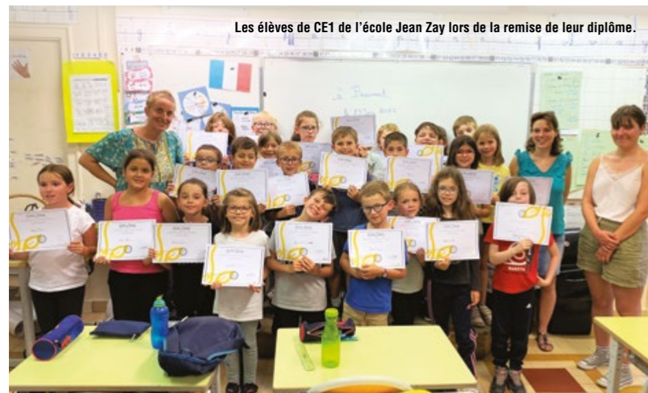
Les élèves de CE1 de l'école Jean Zay lors de la remise de leur diplôme.