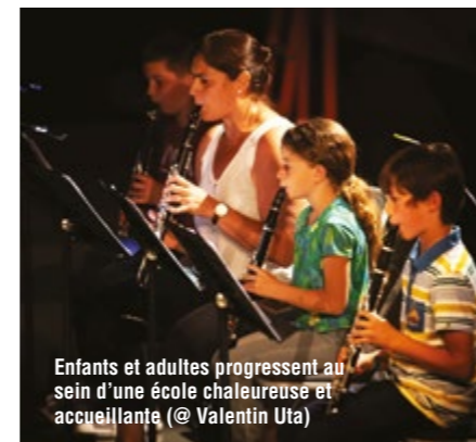
Enfants et adultes progressent au sein d'une école chaleureuse et accueillante

L'École Chantecler proposera plusieurs rendez-vous cette saison encore : au Tremplin le 8 octobre en invitant le Big Band de Jazz du Conservatoire de région, dans le cadre du Téléthon le 25 novembre, à la Ruche le 10 décembre avec un concert autour de la clarinette... Sans oublier le traditionnel concert des familles ou les scènes ouvertes.