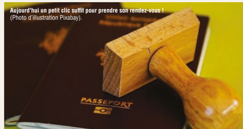
Aujourd'hui un petit clic suffit pour prendre son rendez-vous !

Dans le cadre de la modernisation de l'action publique, la Ville de Beaumont vient de se doter d'un nouvel outil informatique. Il s'agit d'une solution de prise de rendez-vous en ligne pour les cartes nationales d'identité et les passeports. Il est utilisé par de nombreuses mairies en France. Il permet ainsi : la prise de rendez-vous en ligne pour établir ou renouveler ses titres d'identité (CNI et passeports), une meilleure visibilité sur les délais de rendez-vous disponibles, le repérage de créneaux libérés, d'obtenir des informations détaillées sur l'ensemble des pièces à fournir selon les diverses situations, d'accélérer le désengorgement