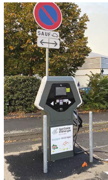
Les bornes sont installées allée Stéphane Hessel et rue du Massage.

Infos complémentaires sur : www.sieg63.orios-infos.com .