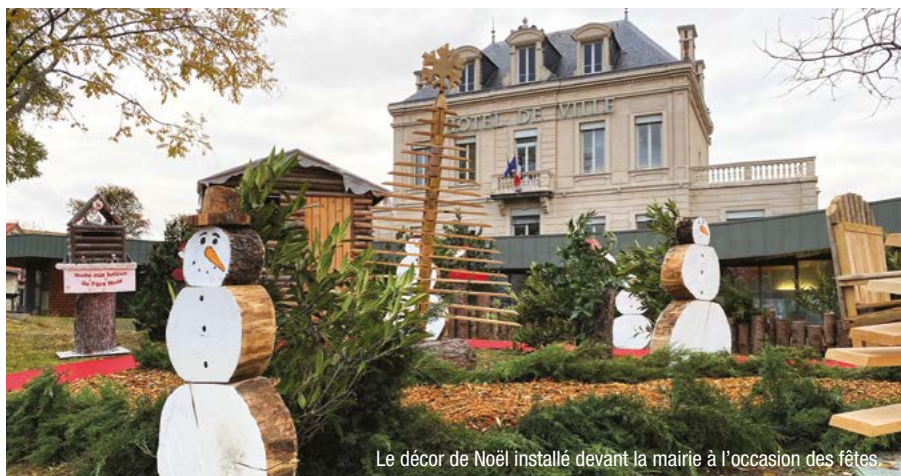
Le décor de Noël installé devant la mairie à l'occasion des fêtes.

À Beaumont, rien ne se perd, tout se transforme ! En 2021, la Ville de Beaumont avait demandé à son service des Espaces verts d'imaginer pour les fêtes de fin d'année