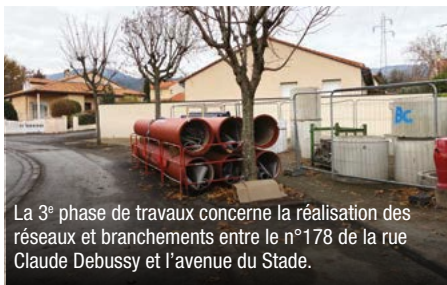
La 3 e phase de travaux concerne la réalisation des réseaux et branchements entre le n°178 de la rue Claude Debussy et l'avenue du Stade.

Entamés il y a un an, les travaux du collecteur sud se poursuivent. Clermont Auvergne Métropole, qui gère ce dossier de remplacement des réseaux d'assainissement, a achevé le programme 2022. Depuis quelques semaines, une nouvelle phase s'est ouverte avec le lancement du programme 2023 qui couvre le haut de la rue Claude Debussy, le parc Debussy ainsi que les chemins piétonniers qui jouxtent le parc. Après la conduite de deux premières phases, une troisième s'est ouverte en février avec la réalisation des réseaux et branchements entre le n°178 de la rue Claude Debussy et l'avenue du Stade. Elle devrait durer jusqu'au 31 mars. Une quatrième phase, prévue entre les mois d'avril et juin 2023, concernera la pose d'un réseau d'eaux usées au niveau du parc Debussy et sur le chemin piétonnier situé à côté du stade.