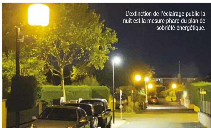
L'extinction de l'éclairage public la nuit est la mesure phare du plan de sobriété énergétique.

En ce qui concerne la mesure phare, l'extinction de l'éclairage public la nuit, elle est effective