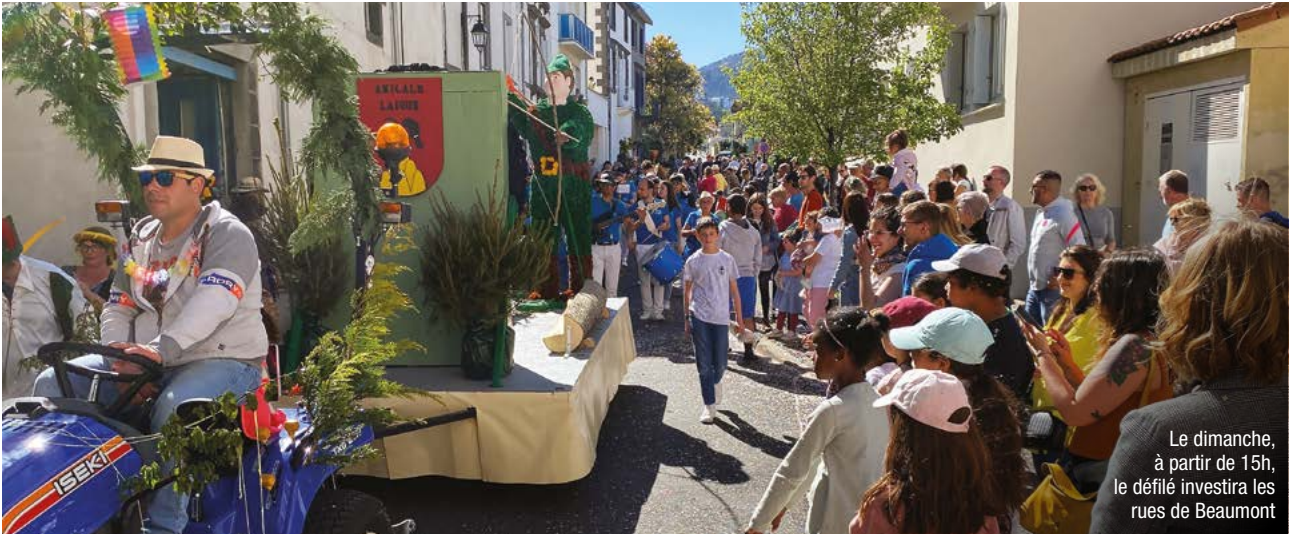
Le dimanche, à partir de 15h, le défilé investira les rues de Beaumont

Après une édition 2022 de transition, la traditionnelle Fête des Cornards retrouve tout son faste à l'occasion de la 60 e édition prévue les 8, 9 et 10 avril