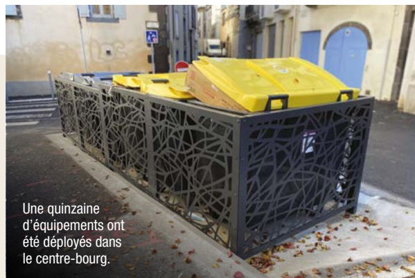
Une quinzaine d'équipements ont été déployés dans le centre-bourg.

Les claustras sont répartis dans quinze sites du centre-bourg : rue Nationale (angle 19 Mars/rue de la Paix et angle impasse Nationale) ; rue Nationale (angle Nationale/Pasteur) ; Place Nationale (angle rue du Commerce) ; place Monthéus ; rue de la Victoire (local Daupeyroux) ; rue de Metz ; rue du Commerce/rue de l'Arcade ; place du Centre ; place Saint-Pierre ; rue Victor Hugo ; place Notre-Dame de la Rivière ; rue Victor