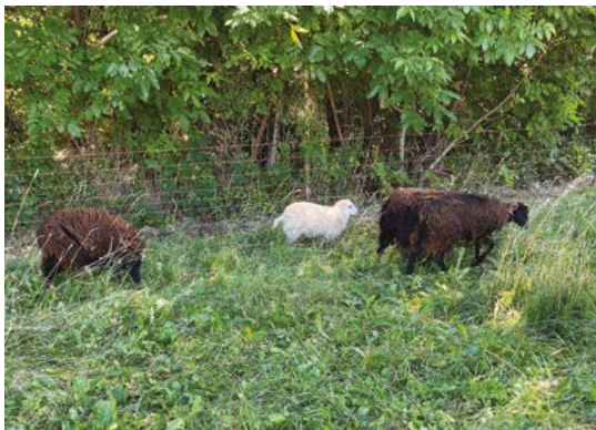
Huit moutons ont œuvré l'été dernier au complexe sportif de l'Artière

E n 2022, la Ville de Beaumont a testé une solution d'éco-pâturage au complexe sportif de l'Artière, en lien avec un éleveur local. Huit moutons ont été installés en deux phases durant l'été. Après la mise en place d'une clôture électrique, ces paisibles animaux ont été chargés d'entretenir naturellement les abords du terrain stabilisé.