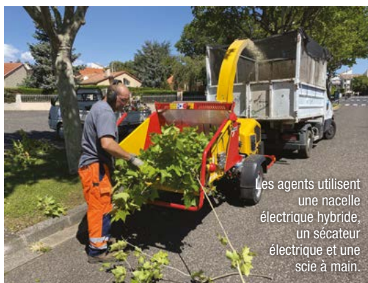
Les agents utilisent une nacelle électrique hybride, un sécateur électrique et une scie à main.

Les restes de coupes sont broyés, compostés et déposés ensuite dans les massifs de fleurs de la commune.