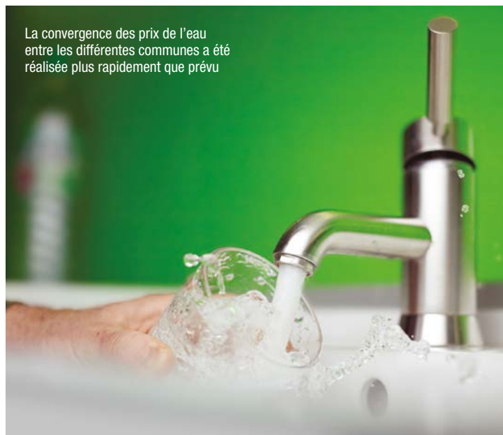
La convergence des prix de l'eau entre les différentes communes a été réalisée plus rapidement que prévu

Depuis 2017, Clermont Auvergne Métropole exerce l'ensemble des compétences liées au cycle de l'eau. 170 agents œuvrent ainsi au quotidien sur différentes missions : produire, distribuer et traiter l'eau potable ; collecter, transporter et traiter les eaux usées ; analyser les eaux ; protéger le milieu naturel, les biens et les personnes ; informer les usagers et les citoyens. Pour faire face aux différentes urgences liées à l'eau et à l'assainissement, notamment celles du dérèglement climatique (sécheresse, raréfaction de la ressource, orages violents, inondations...), la Métropole met en œuvre des investissements très importants. 39 millions d'€ seront ainsi investis en 2023 en matière d'assainissement.