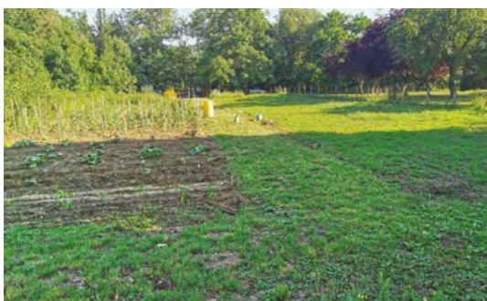
Le club local des Jardiniers des Pays d'Auvergne Beaumont loue une parcelle de 1 600 m 2 (© : JPA Auvergne).

Alors qu'il brille par son dynamisme, avec 80 adhérents et des ateliers thématiques organisés mensuellement, le club local des Jardiniers des Pays d'Auvergne (JPA) Beaumont