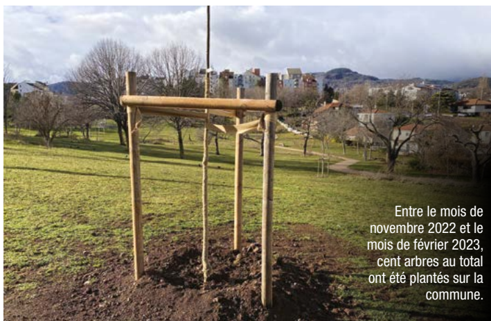
Entre le mois de novembre 2022 et le mois de février 2023, cent arbres au total ont été plantés sur la commune.

Alors que depuis 2020 la municipalité a engagé la commune dans le virage de la transition écologique (dont la mesure phare est la création de la zone maraîchère de la Ronzière), cette importante plantation d'arbres prend tout son sens à l'heure du réchauffement climatique.