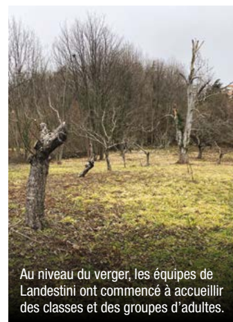
Au niveau du verger, les équipes de Landestini ont commencé à accueillir des classes et des groupes d'adultes.

En intégrant la superficie du verger, ce sont déjà presque 10 000 m 2 qui vont être mis en culture sur le site de la Ferme urbaine.