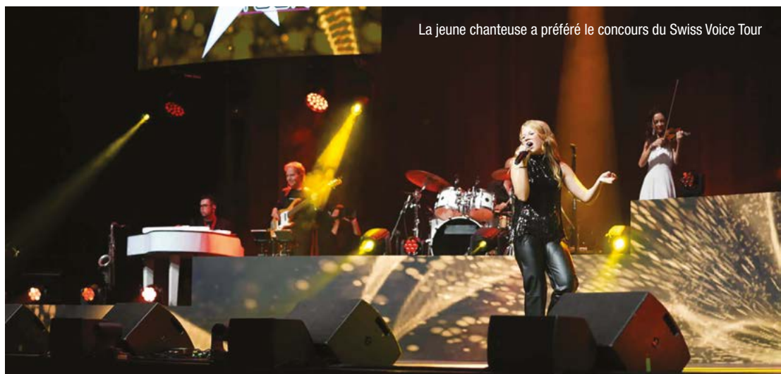
La jeune chanteuse a préféré le concours du Swiss Voice Tour