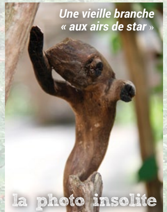
Une vieille branche « aux airs de star »

Présentation publique du chœur amateur Objectif Troupe proposé par la compagnie en résidence Les guêpes rouges-théâtre, à 20 h à la salle Anna Marly de la Maison des Beaumontois. Entrée libre sur réservation au 04 73 15 15 90.