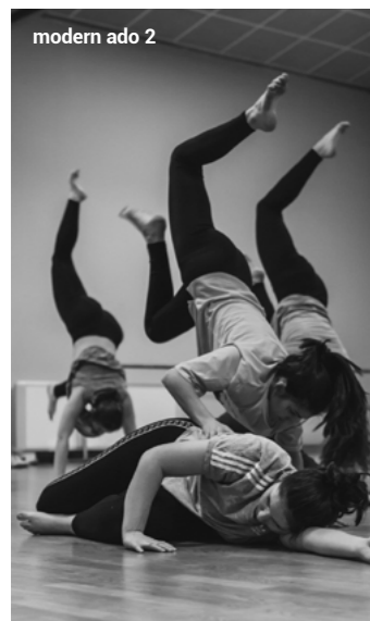
modern ado 2