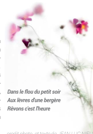
Dans le flou du petit soir Aux lèvres d'une bergère Rêvons c'est l'heure