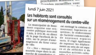
CŒUR DE VILLE. Des prélèvements d'échantillons ont permis de connaître la nature exacte des sols.

Après la grande concertation publique réalisée au début de l'été sur les attentes des Beaumontais, la rentrée a marqué une nouvelle étape dans la poursuite du projet. C'est ainsi que des études de caractérisation des sols ont été réalisées au cours des dernières semaines. En deux phases, une entreprise spécialisée a procédé, à plusieurs endroits, à des prélèvements d'échantillons qui permettent de connaître la nature exacte des sols. « Nous avons réalisé des sondages à la pelle mécanique et au pédomètre. Le but de ces opérations est d'étudier la nature du terrain en place, de voir si le sol renferme des épaves ou de remblai, du rocher basaltique, à quel