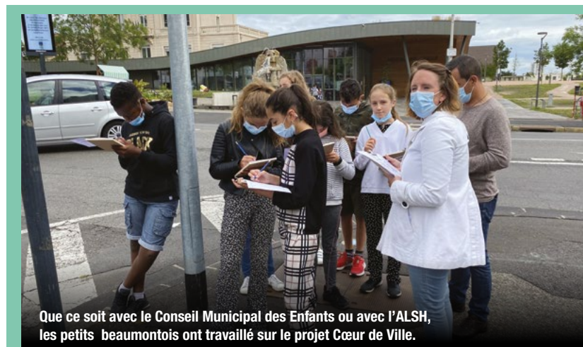
Que ce soit avec le Conseil Municipal des Enfants ou avec l'ALSH, les petits beaumontois ont travaillé sur le projet Cœur de Ville.