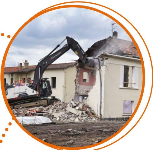
La phase de démolition a débuté au premier trimestre 2021.