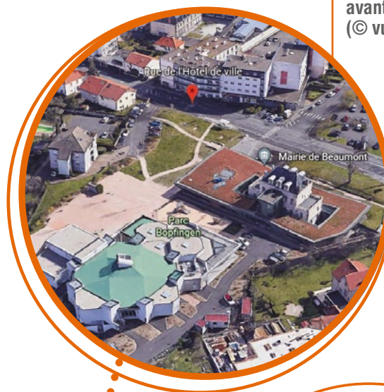
Une vue aérienne du quartier avant le lancement du projet