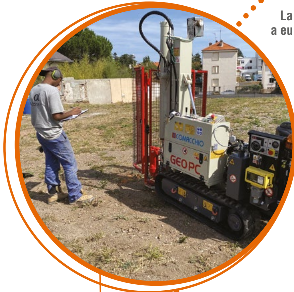
Des études de sols ont été réalisées sur le site à l'été 2021.