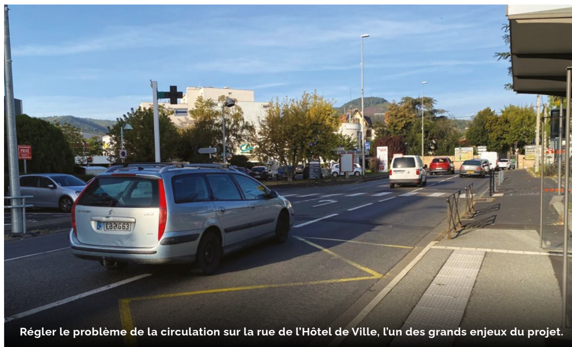
Régler le problème de la circulation sur la rue de l'Hôtel de Ville, l'un des grands enjeux du projet.

Lorsque les élus auront validé les propositions retenues au cours des prochains mois, il sera temps de choisir un maître d'œuvre capable de porter le projet. Un opérateur aux épaules larges, doté d'un talent inné de chef d'orchestre !