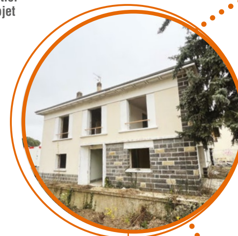
Tous les bâtiments ont été curés au préalable et les matériaux récupérés et recyclés.