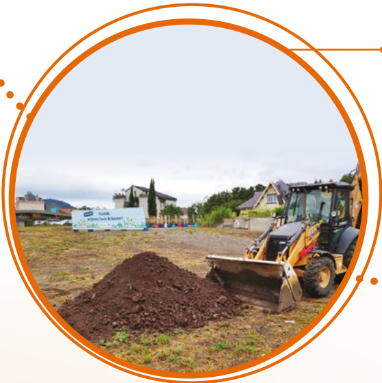
Après la phase d'études, le temps de la reconstruction va pouvoir débuter.