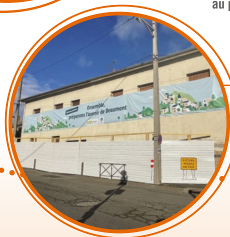
Le secteur de la rue de l'Hôtel de Ville représente une zone de plus de 10 000 m 2 à aménager.