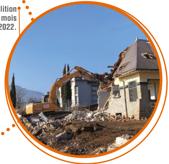
La dernière démolition a eu lieu à la fin du mois de janvier 2022.